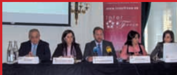
Momento de la rueda de prensa ante los medios franceses.

Además, se ofrecieron datos que avalan la calidad de la fresa onubense, en base a aspectos como producción sostenible, calidad y seguridad alimentaria; producción integrada; sistemas de polinización controlada; control biológico; cultivo ecológico; gestión de calidad total e I+D+i (Investigación+Desarrollo+