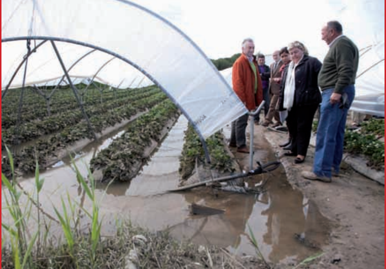
La consejera del ramo durante una visita a una plantación fresera tras el intenso temporal.