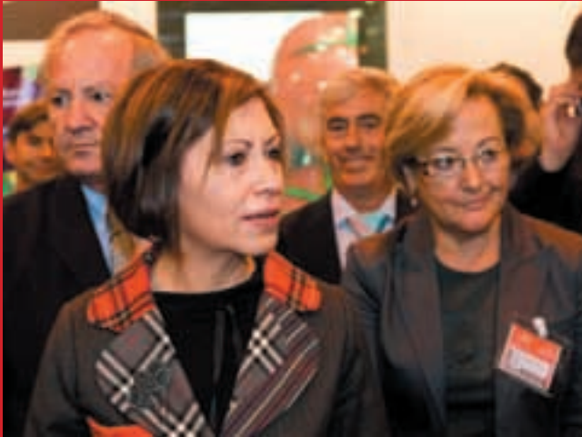
La ministra de MARM, Elena Espinosa, durante Fruit Attraction 2009.