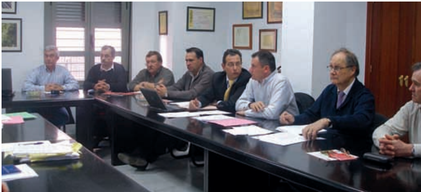
El presidente de Freshuelva con los representantes de la delegación francesa.