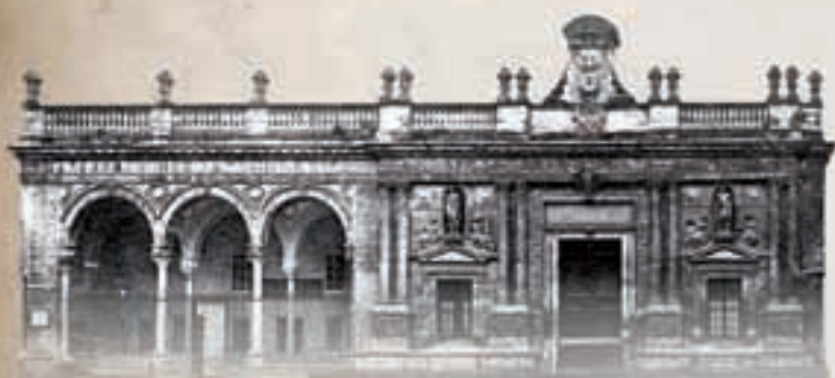
Sede Caja de Ahorros de Jerez. 1834