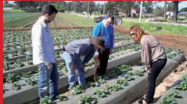
Técnicos del CT Adesva en una explotación fresera californiana.

Los técnicos del CT Adesva han tenido la oportunidad de visitar las fincas de grandes producciones de fresa para su comercialización en fresco e industria, con cultivos al aire libre y en invernadero, así como de otros productos como granado y cítrico. El equipo de investigadores ha conocido también la forma de trabajo de industrias transformadoras de fresa y otras berries, que elaboran bases de frutas para su posterior incorpora-