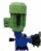
Bomba dosificadora de abono