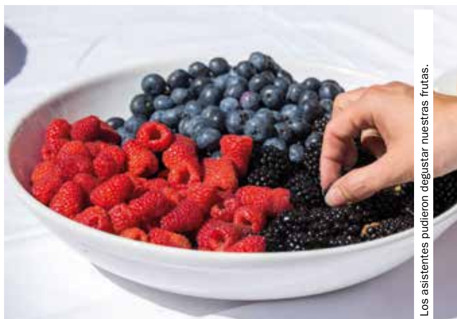
Los asistentes pudieron degustar nuestras frutas.

un valor de 208,7 millones de euros (+33%). La exportación de mora en 2014 se situó en 3.255 toneladas, un 60% más que en 2014 por un valor de 13,8 millones de euros (+38%) y la de grosella ascendió a 1.377 toneladas (+87%) por un valor de 7,7 millones de euros (+191%), según datos de la Dirección General de Aduanas, procesados por Fepex ♦