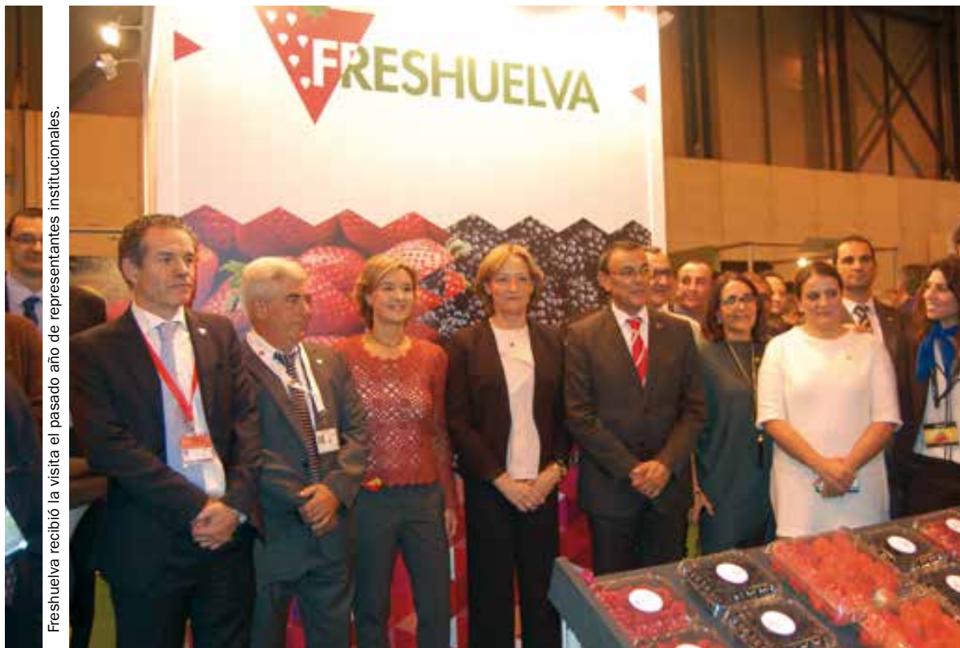
Freshuelva recibió la visita el pasado año de representantes institucionales.

Los profesionales del sector hortofrutícola ya tienen disponible en la web el avance de los expositores que han confirmado su participación en Fruit Attraction 2016, que organizada por Fepex e Ifema, se celebrará del 5 al 7 de octubre, en Madrid.