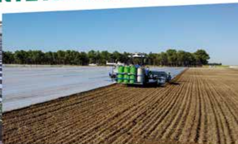
Desinfección a todo terreno en continuo