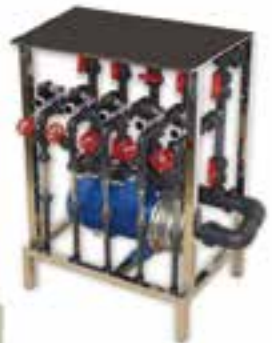
Mesa fertilización Fabricación propia