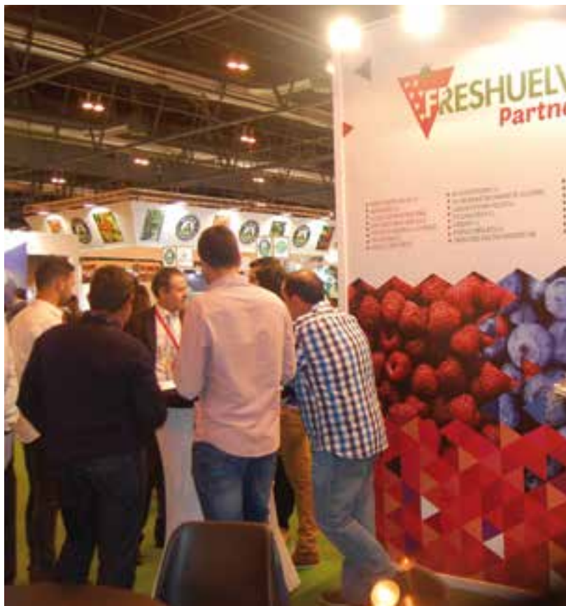
Freshuelva contará con un stand en Madrid.

Con esta iniciativa, Fruit Attraction destaca su capacidad como escenario donde conocer las últimas propuestas del sector, y como plataforma de promoción para las empresas participantes, ante profesionales y medios de comunicación ♦