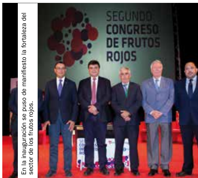
En la inauguración se puso de manifiesto la fortaleza del sector de los frutos rojos.