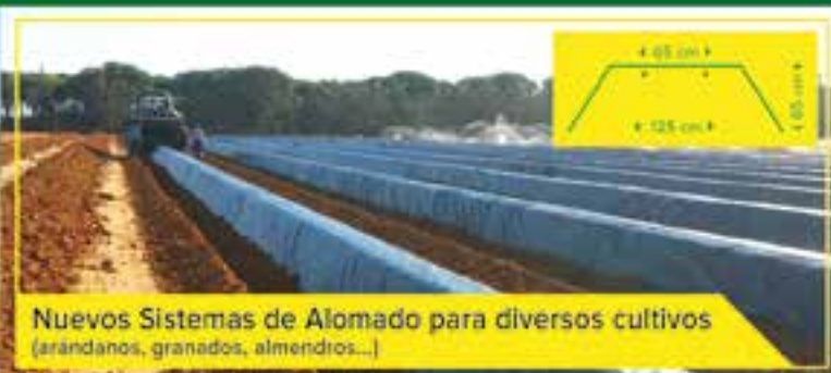
Nuevos Sistemas de Alomado para diversos cultivos (arándanos, granados, almendros...)