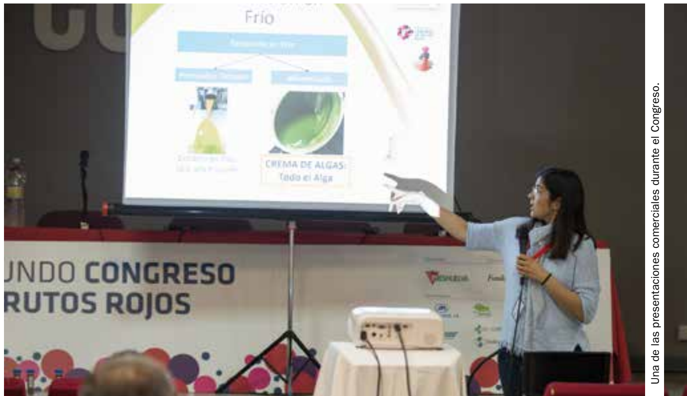
Una de las presentaciones comerciales durante el Congreso.

organizado por Freshuelva, contando con la Fundación Caja Rural del Sur como patrocinador principal y el Ayuntamiento de Huelva como patrocinador institucional.