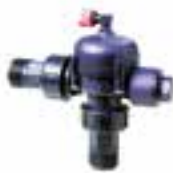
Válvula productos químicos