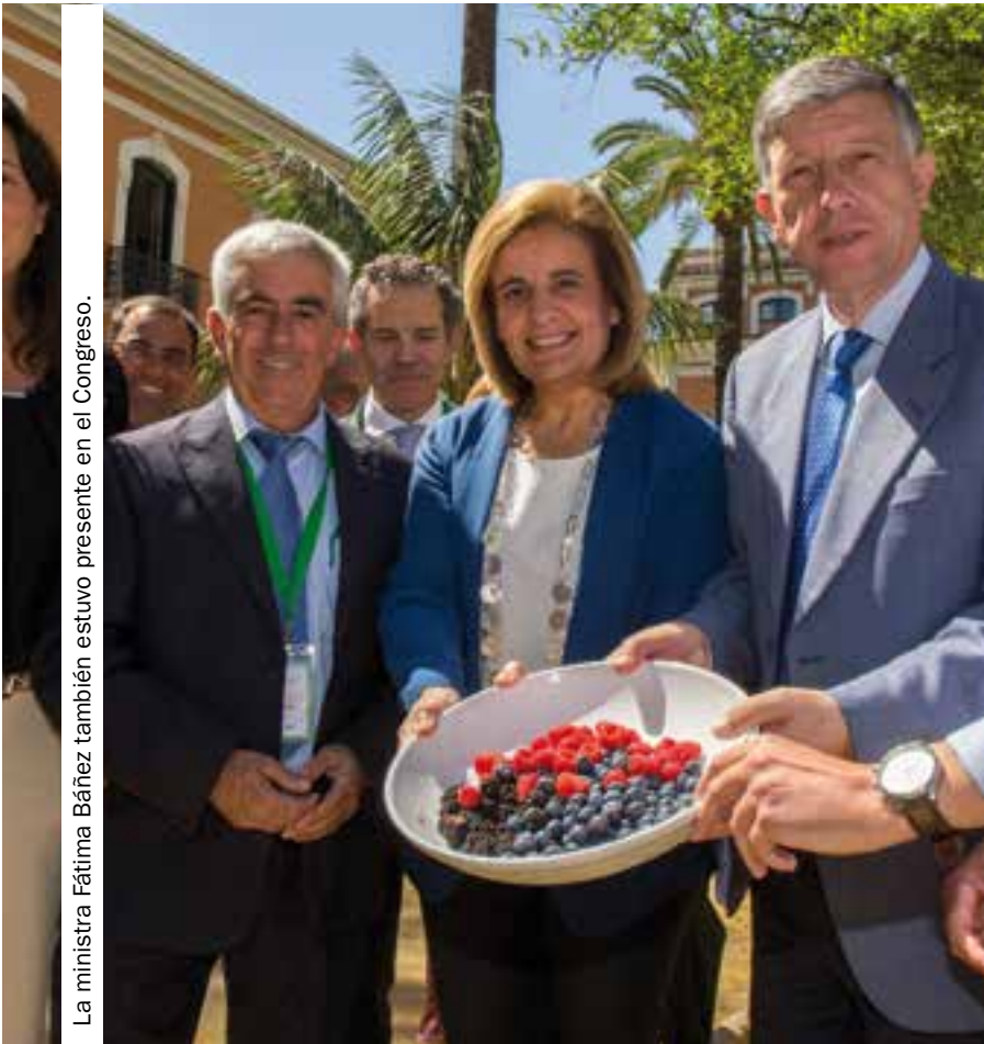
La ministra Fátima Báñez también estuvo presente en el Congreso.

La Casa Colón de Huelva volvió a vestirse de largo para acoger la segunda edición del Congreso de Frutos Rojos, que, de nuevo, congregó a más de 1.000 personas que debatieron y trabajaron sobre el presente y futuro de los berries onubenses.