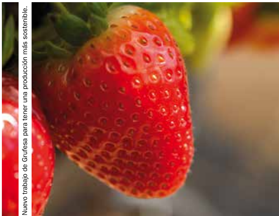
Nuevo trabajo de Grufesa para tener una producción más sostenible.

Este sistema, que es totalmente respetuoso con la planta y con el entorno, “mejora considerablemente la calidad del agua que aportamos a nuestra fruta y, además, mantiene desinfectado el sistema de tuberías”. Martínez indicó que se trata de un “sistema integrado mediante el que se aporta una cantidad controlada