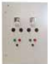
Variador dos motores