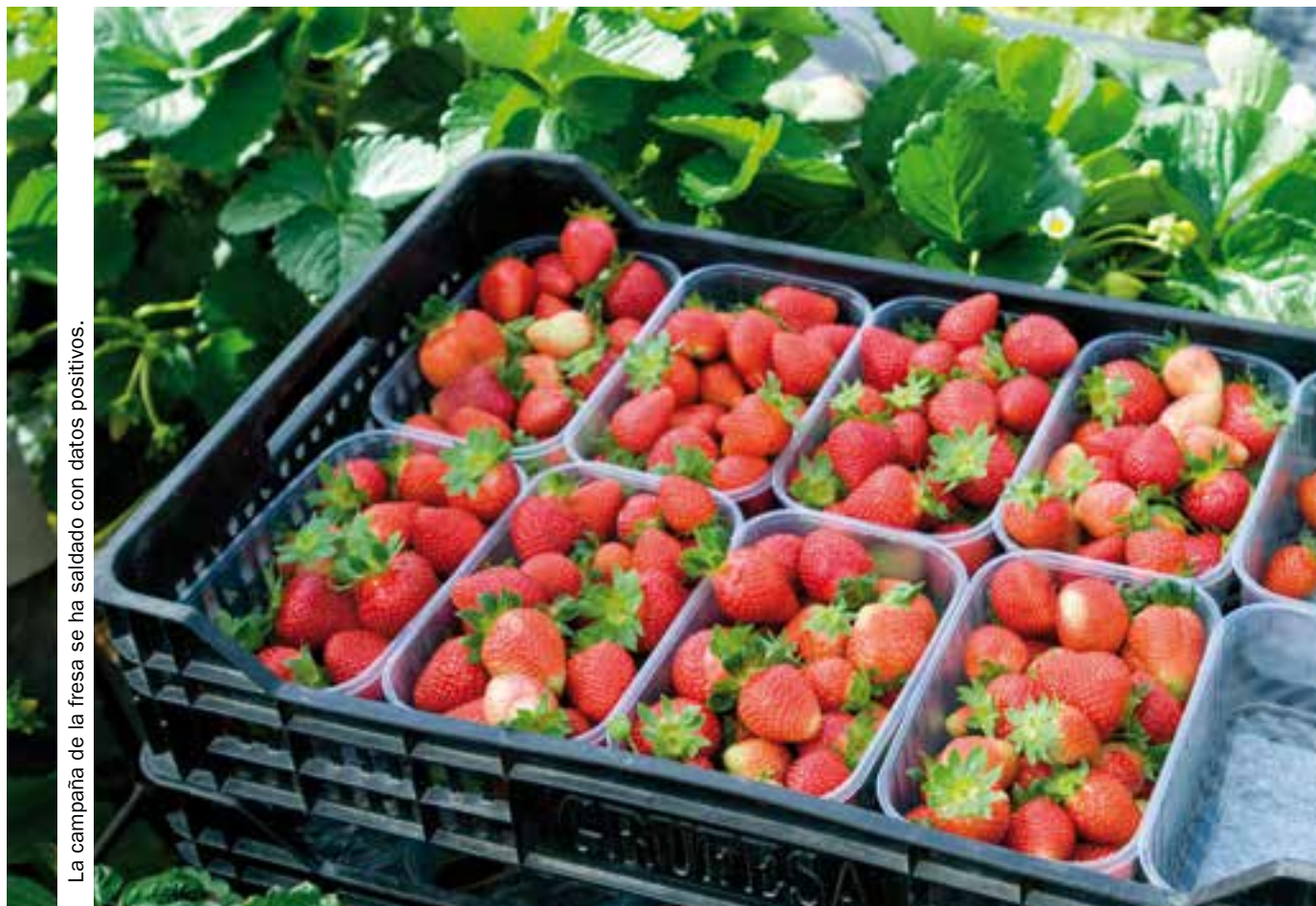
La campaña de la fresa se ha saldado con datos positivos.

La producción aumenta un 2 % pese al descenso de hectáreas, al igual que la frambuesa, cuya producción crece en un 10 %, mientras la facturación lo hace en un 24 %.