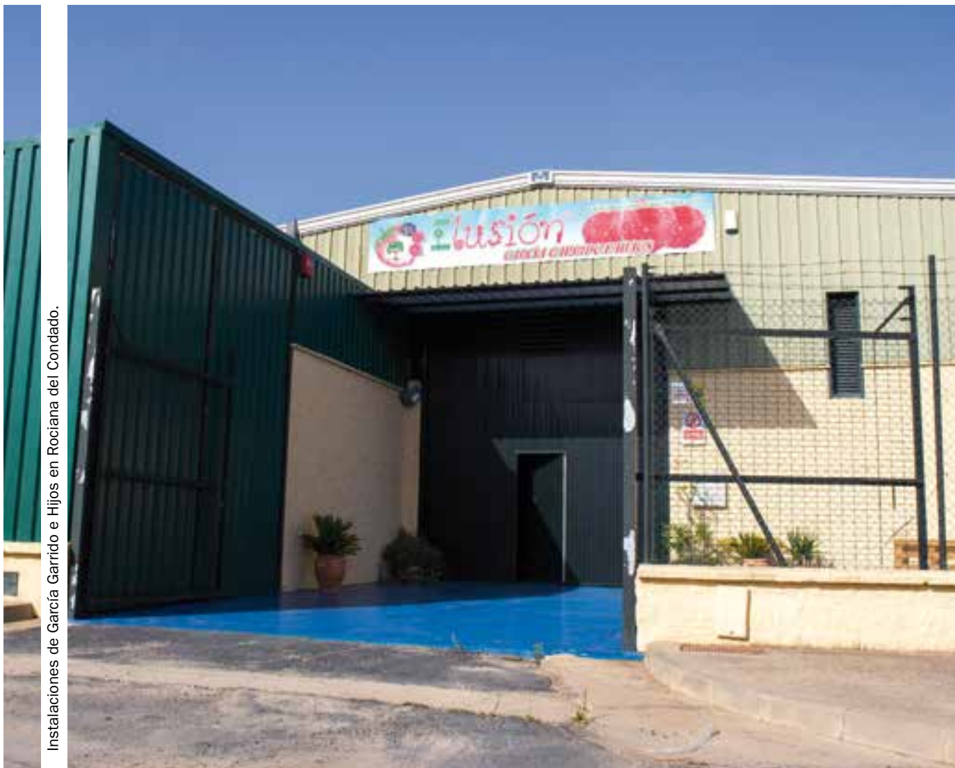
Instalaciones de García Garrido e Hijos en Rociana del Condado.

García Garrido e Hijos, referente de producción y comercialización de la frambuesa. La empresa familiar García Garrido e Hijos avanza cada campaña en una producción de frambuesas que se caracteriza por el respeto del entorno. La próxima campaña superarán las 30 hectáreas.