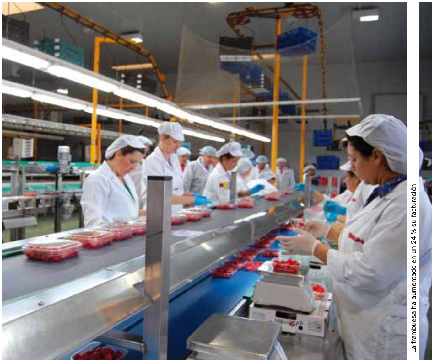
La frambuesa ha aumentado en un 24 % su facturación.

El calor de los primeros días de junio ha propiciado el fin de la campaña de manera paulatina en las diferentes comarcas productoras, dado que las altas temperaturas afectan a la calidad de la fruta y a su consistencia.