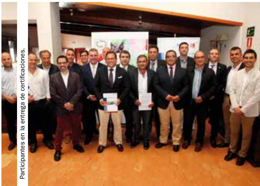
Participantes en la entrega de certificaciones.

Tres nuevas empresas productoras de berries han recibido la certificación Zerya, que diferencia a las empresas que utilizan sistemas de producción de alimentos que garantizan un producto final sin residuos. Estas empresas han sido las onubenses y asociadas de Freshuelva SAT Algaida y Special Fruit Producciones, ubicadas en Almonte, mientras que la tercera, Sunshine Fruit, se encuentra en la localidad portuguesa de Tavira.