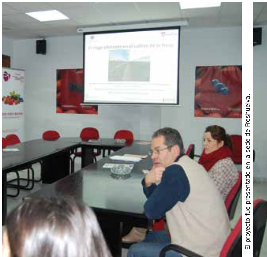
El proyecto fue presentado en la sede de Freshuelva.