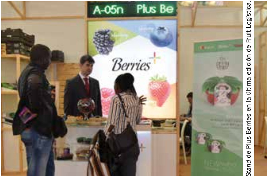
Stand de Plus Berries en la última edición de Fruit Logística.

Plus Berries, premio ‘Onubense del Año’ del periódico ‘Huelva Información’. Ha obtenido el respaldo de los lectores del diario onubense en la categoría de Economía y Empresa en los galardones que se entregan de forma anual.