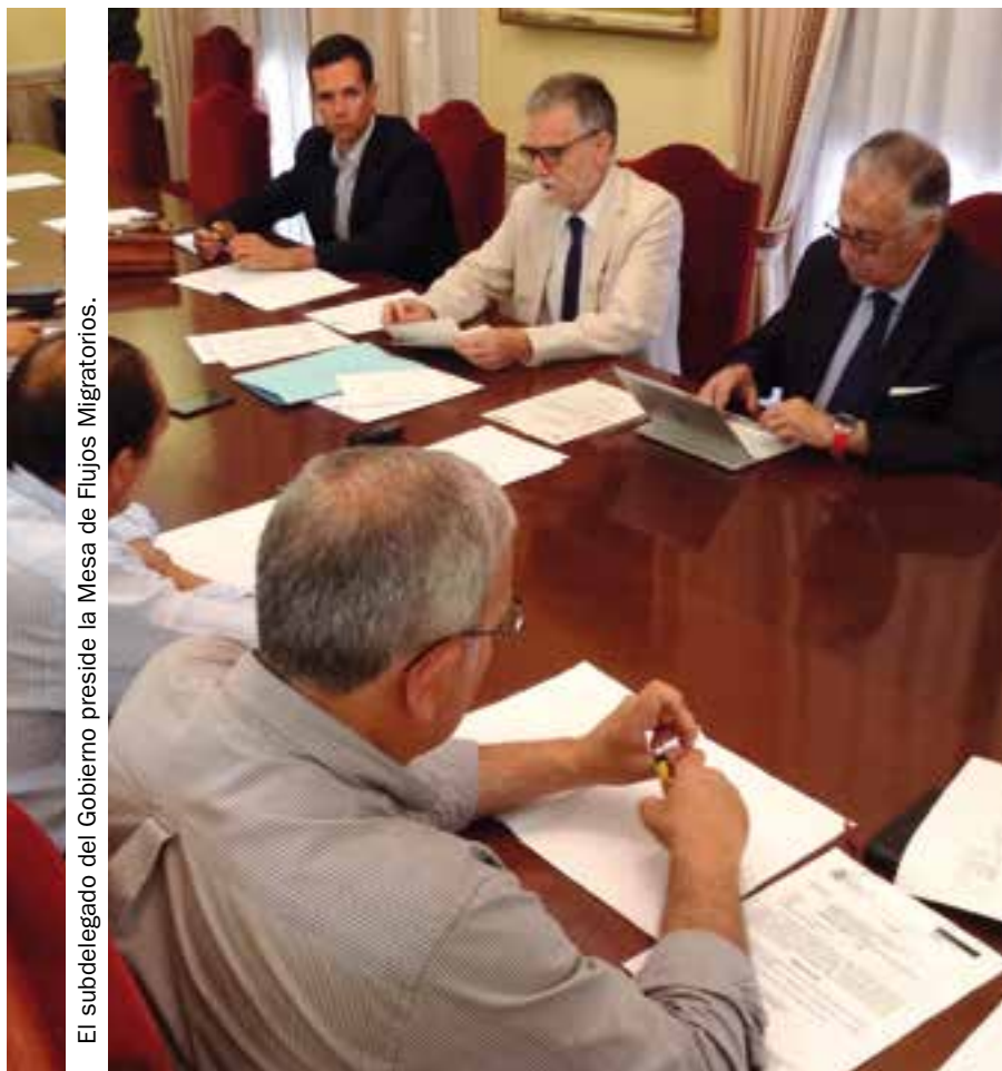
El subdelegado del Gobierno preside la Mesa de Flujos Migratorios.

El subdelegado insistió, una vez más, en apostar por los trabajadores locales “para seguir reduciendo la cifra de desempleados” que registra la provincia, dando prioridad a la mano de obra de los pueblos agrícolas donde se abren “nuevas oportunidades de futuro”, gracias al trasvase