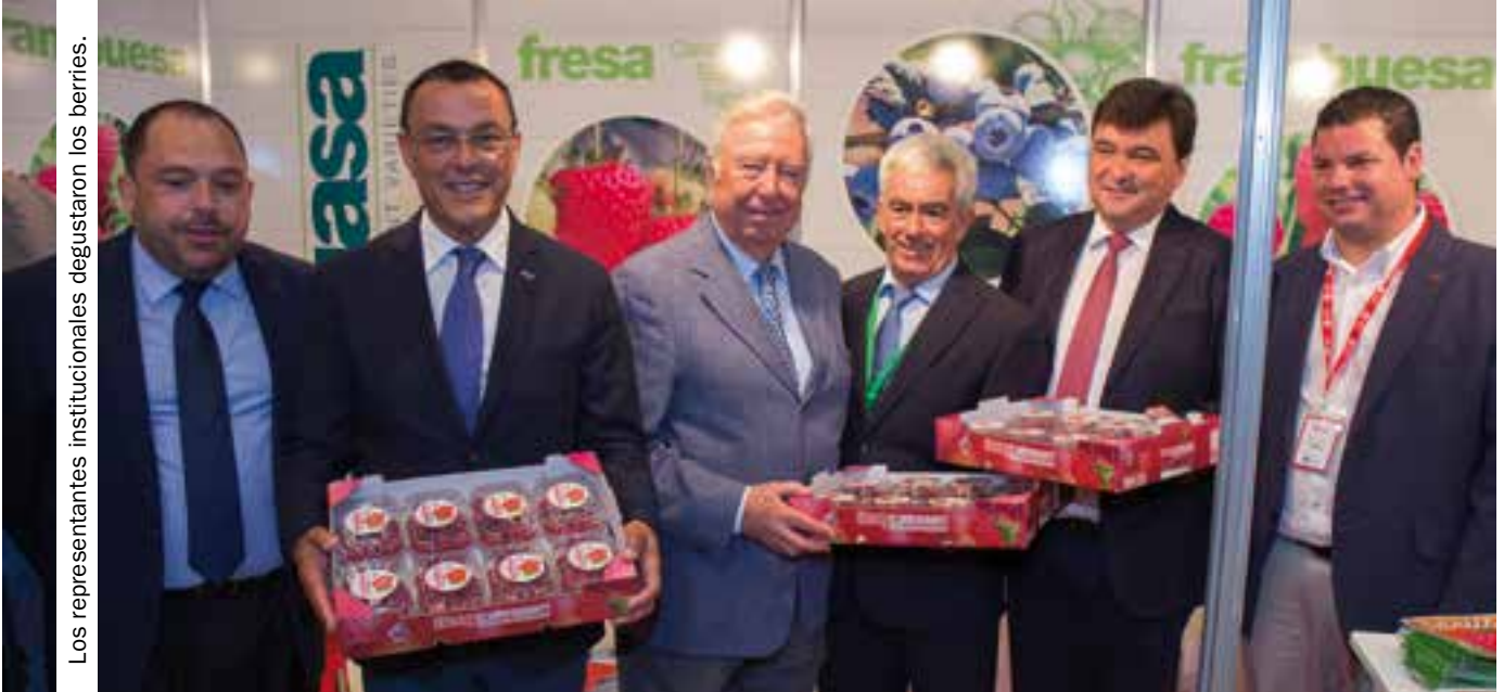
Los representantes institucionales degustaron los berries.