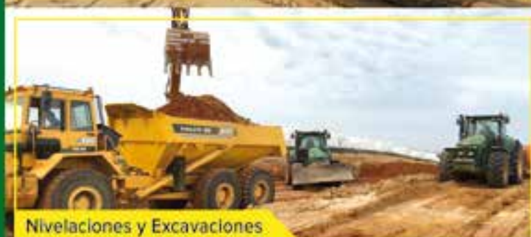
Nivelaciones y Excavaciones