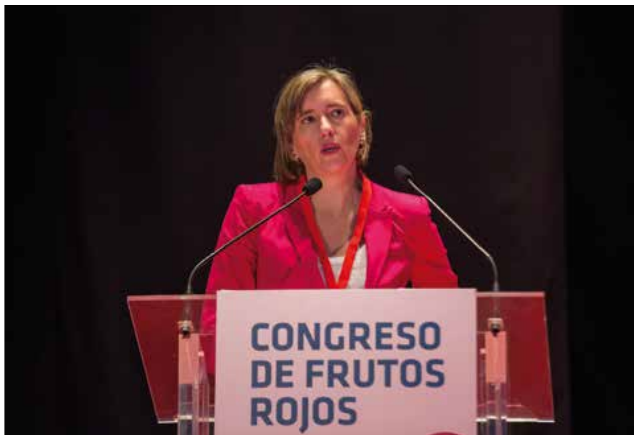
La consejera delegada de Extenda durante su intervención en el Congreso.