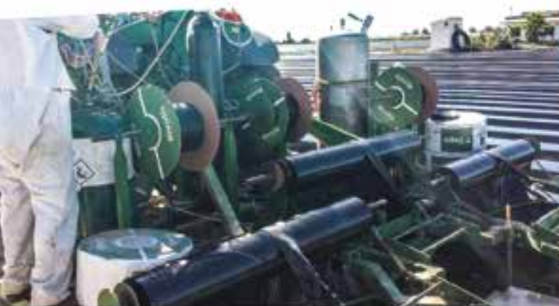
Desinfección localizada al efectuar los lomos de cultivo