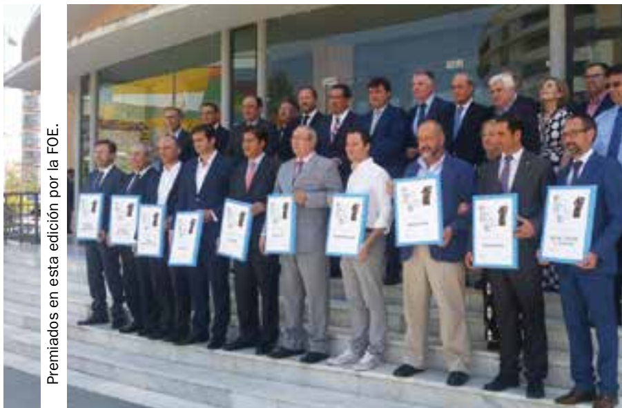
Premiados en esta edición por la FOE.

Agrícola El Bosque y Fresón de Palos, premios Empresarios del Año de la FOE. El presidente de la Federación de Empresarios Onubenses reconoce la voluntad, el esfuerzo, el sacrificio y la solidaridad de las entidades premiadas.