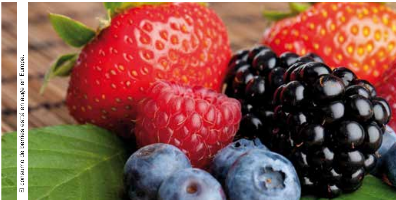
El consumo de berries está en auge en Europa.

Muchos países de la UE podrían seguir los pasos de los EE.UU., donde las berries se han convertido en la mayor categoría de alimentos al por menor de productos frescos, por delante de los principales alimentos básicos como manzanas y naranjas. Según el último informe de Rabobank 'Burgeoning & Blossoming: The Bar is Raised in the Promising EU Berry Market', solo el cielo parece ser el límite en el sector de las berries en el continente europeo.