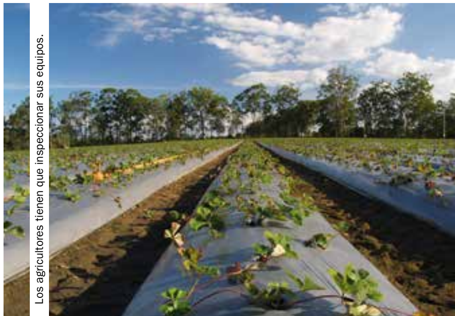
Los agricultores tienen que inspeccionar sus equipos.

Todos los equipos de aplicación de productos fitosanitarios deben ser verificados antes de cinco años desde la fecha de compra. Posteriormente, la periodicidad pasa a ser de tres años. En 2016, deberán ser verificados los equipos comprados en 2011 o con anterioridad.