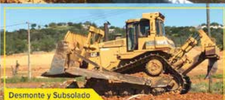
Desmorte y Subsollado