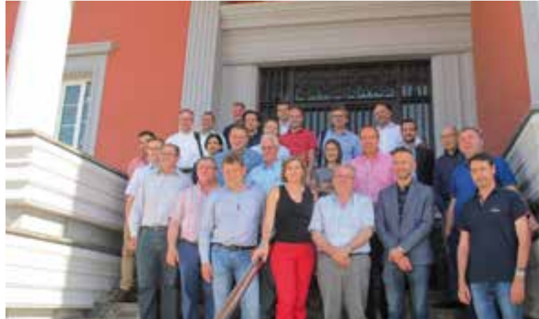
Plus Berries ha participado en este encuentro de comercialización en Almería.