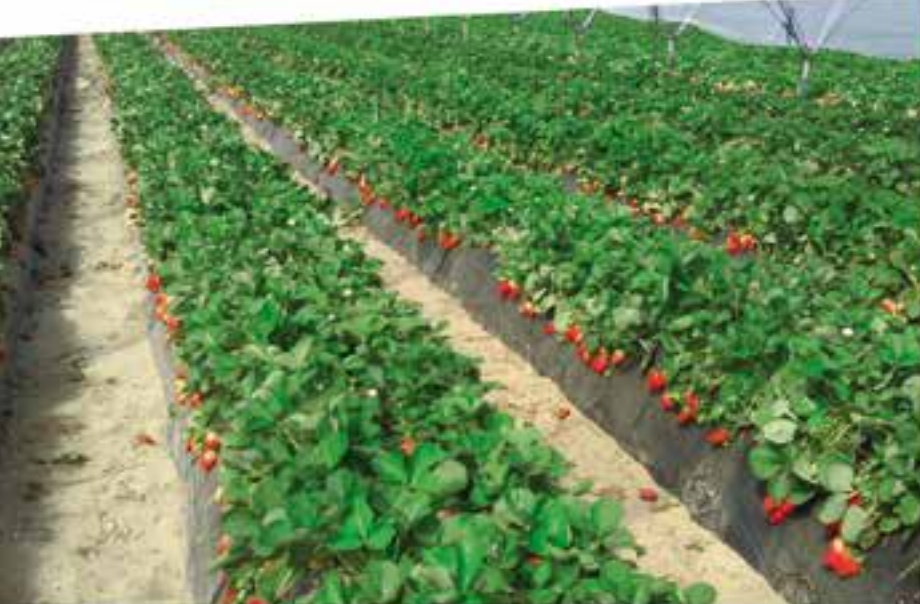
Lomos desinfectados localizadamente con Tripicrin