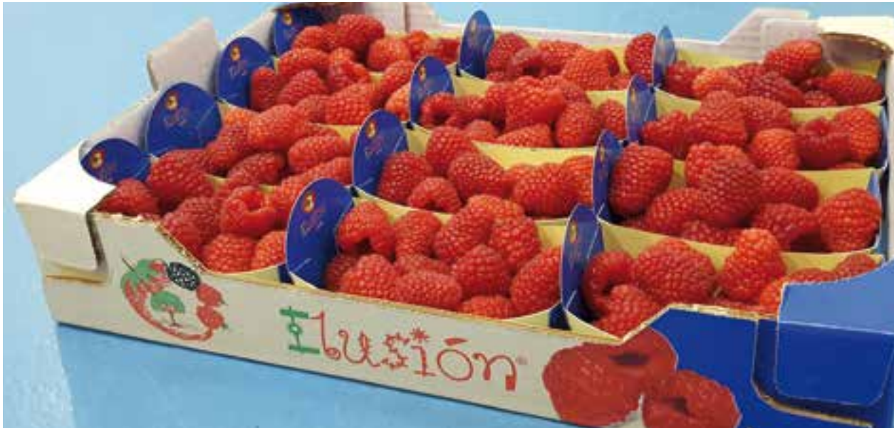
Ilusión es la marca con la que García Garrido e Hijos comercializa su frambuesa.

Con una producción en la actual campaña de 160 toneladas de frambuesas de las variedades Glen Lyon, Glen Roció, Tulameen, Adelita y Kwanza, la previsión para la próxima es superar las 30 hectáreas en plantación e incluso aumentar el número de variedades para poder satisfacer la demanda de los clientes, siempre que la disponibilidad de agua lo permita.