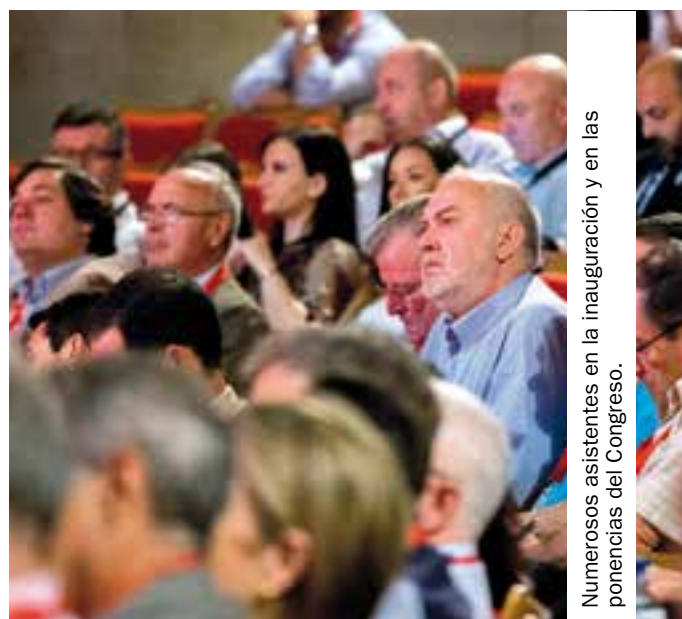
Numerosos asistentes en la inauguración y en las ponencias del Congreso.

realiza a través de la campaña 'Fresas de Europa'.