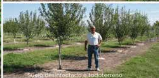
Suelo desinfectado a todo terreno