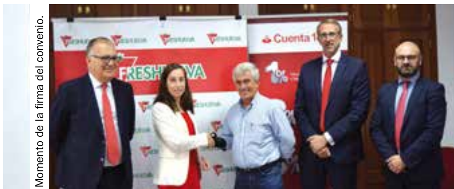
Momento de la firma del convenio.

De esta forma, la entidad bancaria colaborará con Freshuelva en este proyecto que pretende aunar esfuerzos en defensa del sector por parte de todos los actores que trabajan en el mismo, al tiempo que se beneficiará de las ventajas que conlleva formar parte del grupo de empresas que engloban la figura de Freshuelva Partners, tal como participar de forma activa en congresos y ferias como Fruit Attraction.