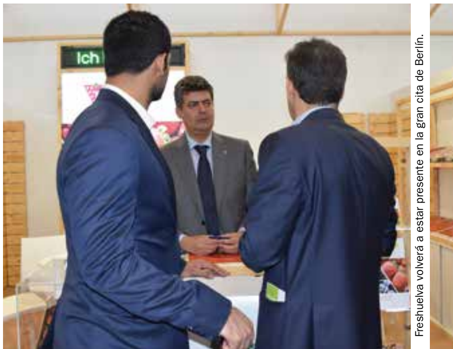
Freshuelva volverá a estar presente en la gran cita de Berlín.

Sin duda, Fruit Logística –que celebra en 2017 su 25 aniversario– se ha situado en el panorama internacional como la cita clave del sector hortofrutícola mundial, un evento que congregó el pasado año a más de 70.000 profesionales de 138 países. “En este mundo cada vez más digitalizado es muy importante poder verse cara a cara, por lo menos una vez al año. El negocio de frutas se basa