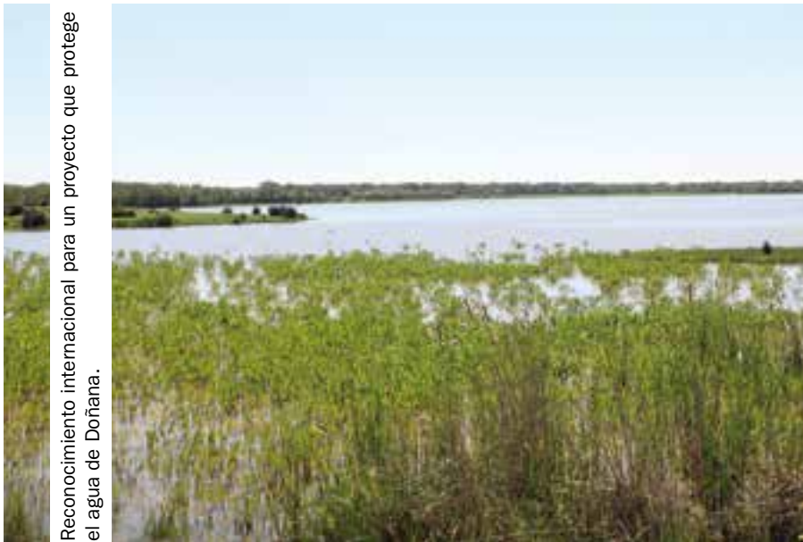
Reconocimiento internacional para un proyecto que protege el agua de Doñana.

Los freseros de Huelva lograron el año pasado reducir el consumo de agua en un 40 %, lo que significa que ahorraron 1,7 billones de litros de agua en un área especialmente sensible, por encontrarse en las inmediaciones del Parque Nacional de Doñana, declarado Reserva de la Biosfera desde 1980. Este logro fue posible gracias a un proyecto financiado por la empresa Innocent Drink, filial de Coca Cola, y desarrollado por el equipo de investigación AGR 227 Hidráulica y Riegos de la Universidad de Córdoba, merecedor del Guardian Sustainable Business Award , en su categoría 'Agua'.