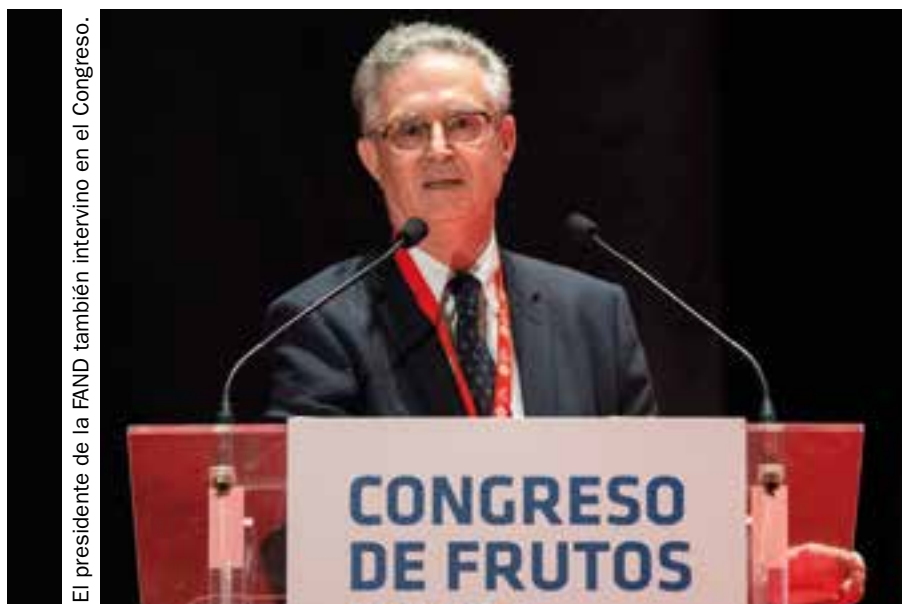
El presidente de la FAND también intervino en el Congreso.

El punto de vista médico acerca de los beneficios que para la salud tiene el consumo de berries fue otro de los temas tratados en la primera jornada del II Congreso de Frutos Rojos.