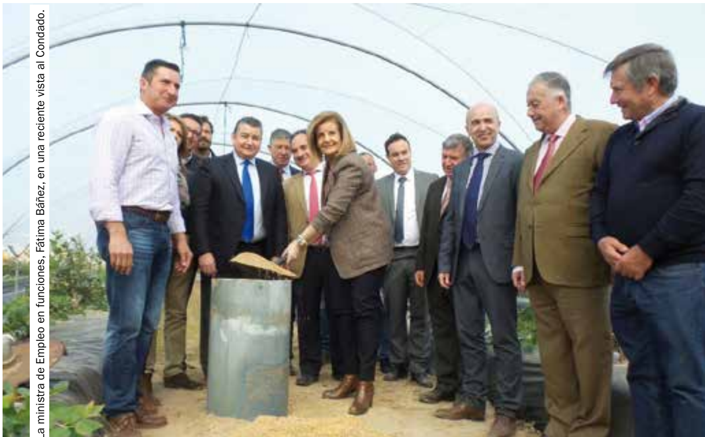
La ministra de Empleo en funciones, Fátima Báñez, en una reciente visita al Condado.

El Gobierno autoriza la transferencia anual de 4,99 hm 3 de agua al Condado. La Plataforma lamenta que, aunque se haya dado luz verde a esta aprobación, el agua aún no se puede utilizar, con lo que no cambia la situación dramática de los agricultores.