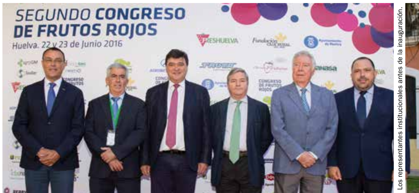
Los representantes institucionales antes de la inauguración.