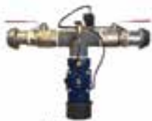
Hidratante con electroválvulas

ROPA DE TRABAJO - PROTECCIÓN LABORAL FERRETERÍA INDUSTRIAL RIEGOS AUTOMÁTICOS