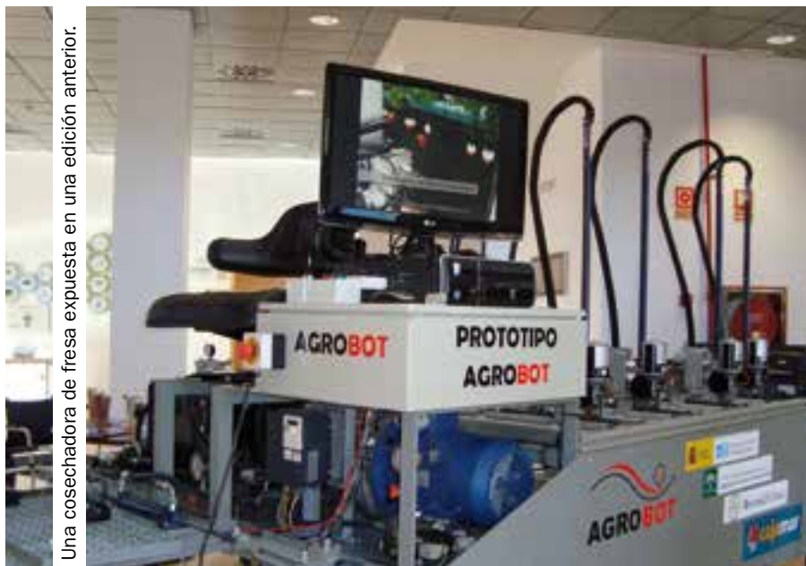
Una cosechadora de fresa expuesta en una edición anterior.

El encuentro ha contado con la presencia de numerosos representantes del sector agrícola y empresarial lepero, que han fechado y concentrado el certamen entre los días 21 y 22 de septiembre, con ubicación en la sede de Adesva en el parque industrial La Gravera ♦