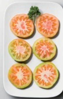
ESTE TOMATE ES ESTUPENDO

escribir unas palabras más en el segundo párrafo para que bajo la línea!!!