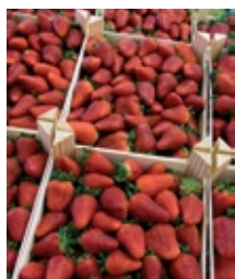
Diseño de portada: Gestocomunicación

Actualmente nos encontramos en el punto de inflexión de esta campaña, los mercados europeos empiezan a recibir los tonelajes previsibles de fresa y frambuesa y la meteorología empieza a ser la esperada para una incipiente primavera que ilumina nuestra esperanza en una campaña que hasta la fecha ha tenido más sombras que luces. No obstante debemos ser perseverantes en nuestros objetivos: calidad, sanidad y "compromiso verde".