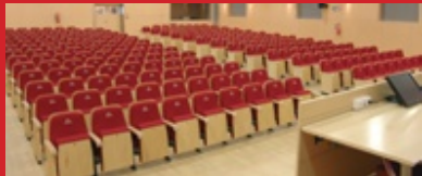
Las nuevas instalaciones de Fresón de Palos fueron inauguradas por el consejero.

La cooperativa Fresón de Palos está de estreno con sus nuevas instalaciones después de haber llevado a cabo la reforma y rehabilitación del edificio ya existente y la construcción de uno nuevo que alberga las oficinas. Ambos proyectos han contemplado los requisitos básicos de funcionalidad, garantizando también el acceso a los servicios de telecomunicaciones y cumpliendo los requisitos básicos en cuestiones de seguridad estructural y seguridad en caso de incendio.