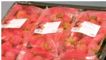
El nuevo envase impide la condensación del producto.

Apoyado en un estudio de mercado realizado con fresas por el instituto BAV para el aseguramiento de higiene y calidad, el Flow-Fresh resulta un envase óptimo para