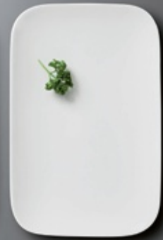
PERO ÉSTE ESTÁ DE LUJO