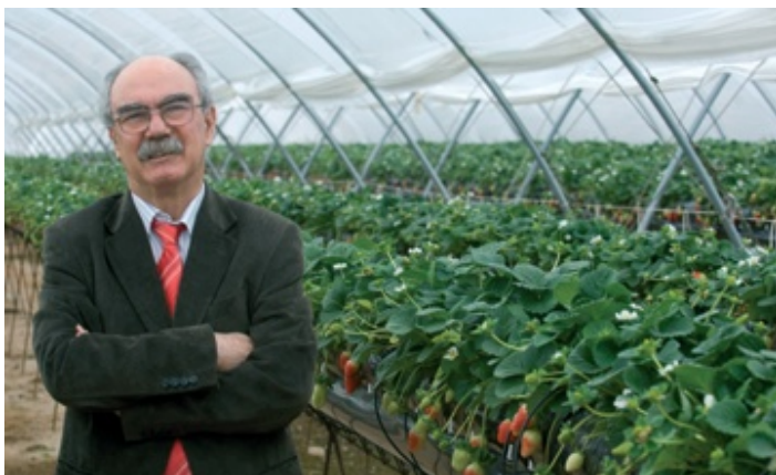
El alcalde de Cartaya, Juan Antonio Millán, en una de las plantaciones freseras de la provincia.